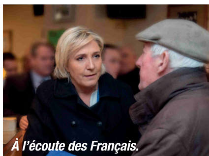
À l'écoute des Français.