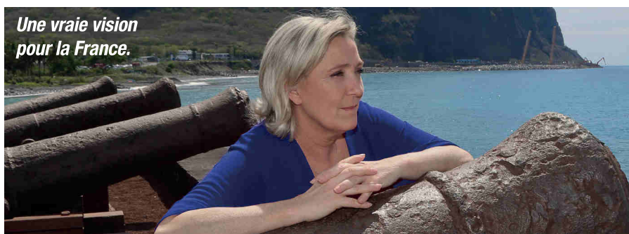
Une vraie vision pour la France.